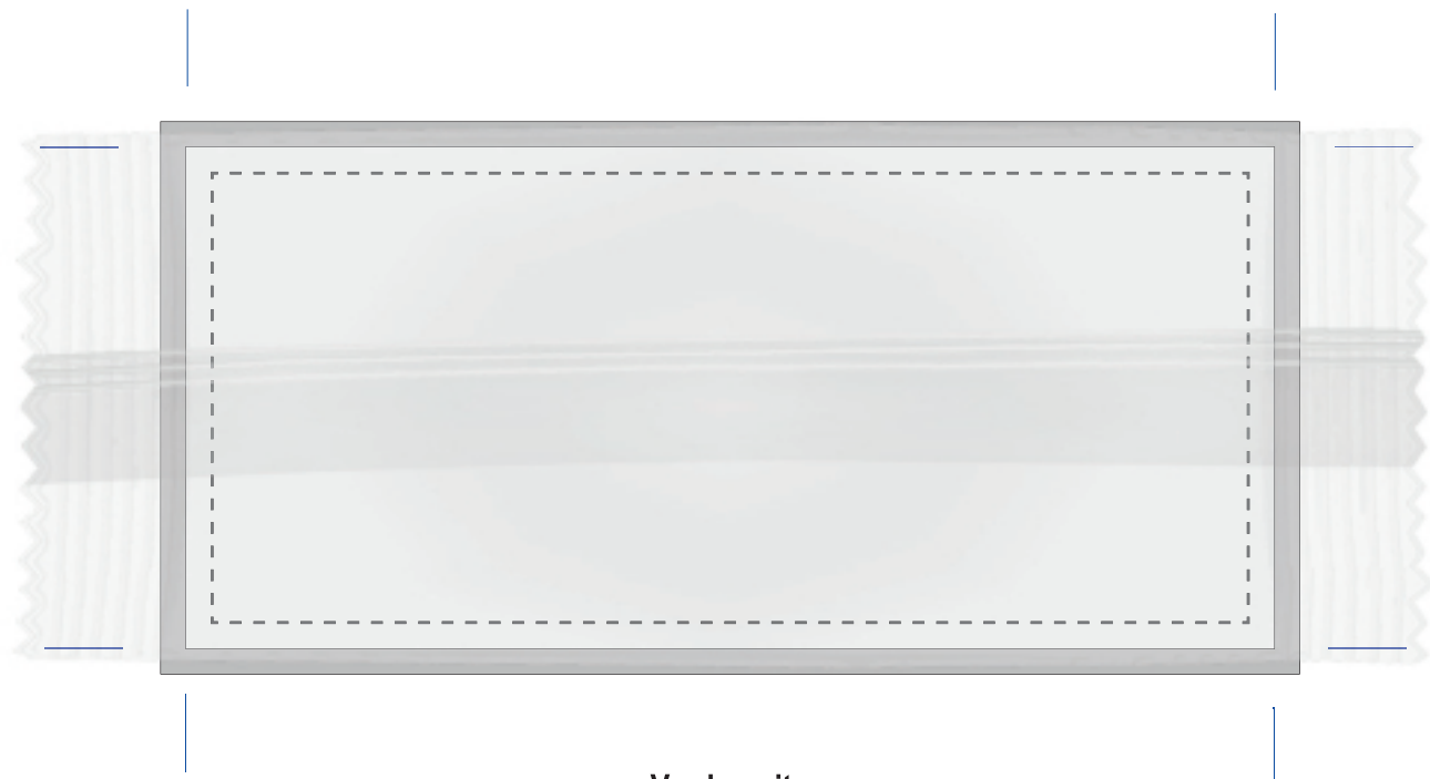
Vorderseite Bitte Zellglasfolienstreifen beachten